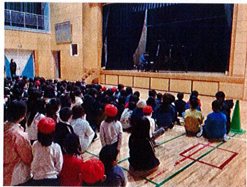
6年生が連弾を披露

「自己肯定感」「共感的な人間関係」「自治」「自己決定」「自己調整」。乙川東小学校で大切にしている力を総合的に発揮する機会となっています。