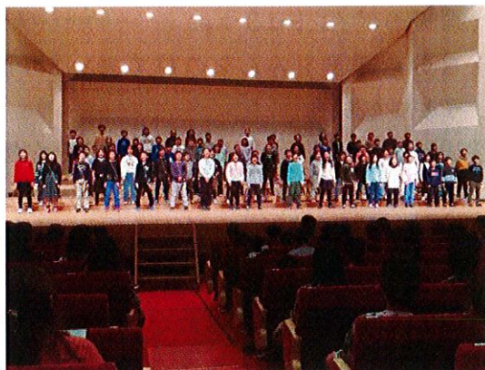
4年生 半田市音楽会 合唱