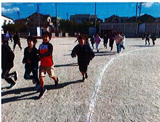
大放課のかけっこ週間