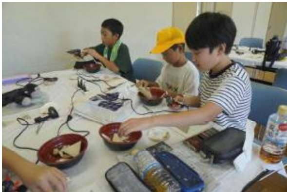
思い出の砂時計作り