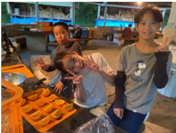
カレーづくり 手際よく準備しました