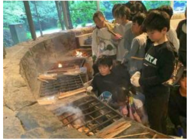
火おこし がんばりました！