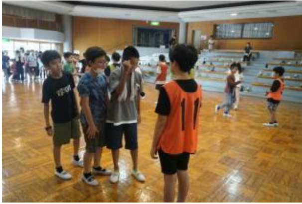
学年レクリエーション