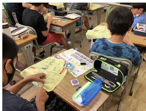
5年生：初めての裁縫