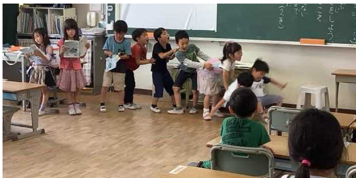
1年生：「大きなかぶ」音読発表会