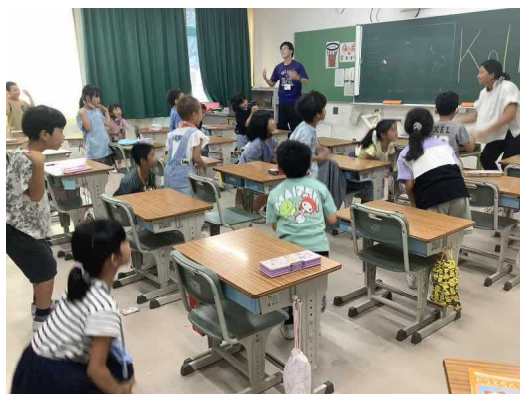
2年生：A L Tと英語の歌