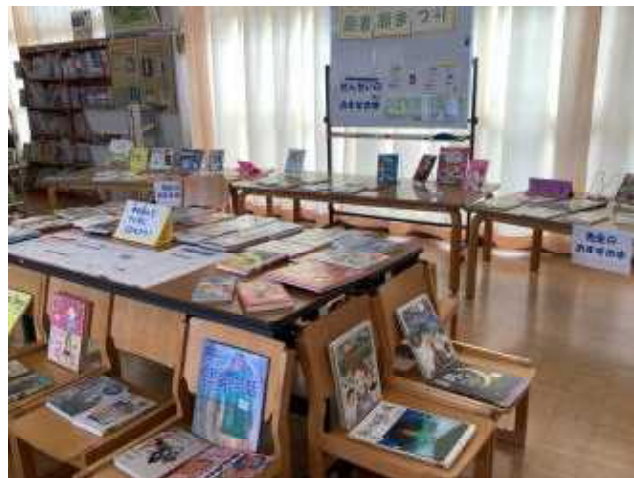
図書館まつりの会場

朝の読書タイムに6年生のクラスをのぞくと、子どもたちと同じように夢中で本を読んでいる担任の姿がありました。大人も子どもも本の世界に浸る時間、いいですね。